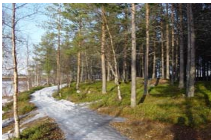
RANTAPUISTO KOHTI JUUTUANJOEN SILTAA