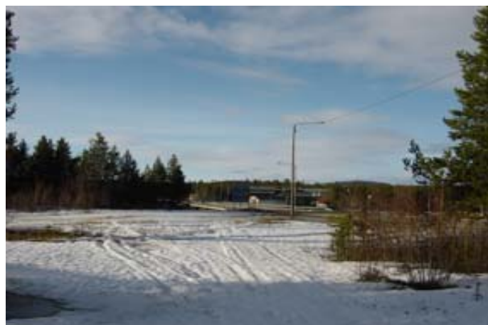
NÄKYMÄ KOILLISEEN KOHTI SIIDAA